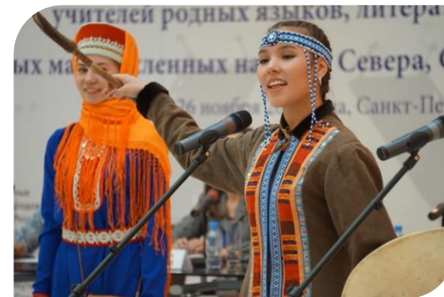
ФОЛЬКЛОРНЫЙ ТЕАТР-СТУДИЯ «СЕВЕРНОЕ СИЯНИЕ»