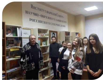
МУЗЕЙ ИСТОРИИ ИНСТИТУТА НАРОДОВ СЕВЕРА