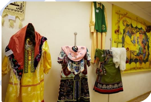
КАБИНЕТ ДЕКОРАТИВНО- ПРИКЛАДНОГО ИСКУССТВА И ХУДОЖЕСТВЕННЫХ ПРОМЫСЛОВ НАРОДОВ СЕВЕРА